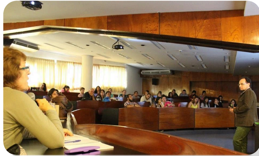
Congreso de Bioturismo. Paraguay. 2018.

El Curso en Bioturismo está diseñado con la intención de formar recursos humanos especializados en la formulación y evaluación de proyectos que aprovechen la riqueza de la diversidad biológica presente en los espacios naturales manteniendo una relación armónica y de mínimo impacto con los ecosistemas y favoreciendo el desarrollo local.