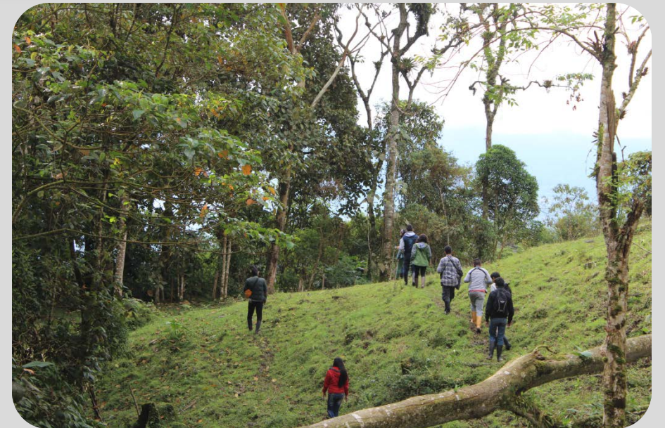
Curso de Rastreo y Monitoreo de Fauna. Colombia. 2018.